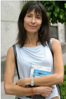
Carla Guelfenbein viaja apoyada por la Dirac al Festival de Literatura de Berlín.

- La escritora Carla Guelfenbein fue invitada al Festival de Literatura de Berlín, que tendrá lugar del 15 al 26 de septiembre, y contempla presentaciones en Berlín, Hamburgo, Munich y Colonia. Su visita a Alemania contará con el auspicio de la Dirac.