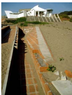
La Ciudad Abierta de Ritoque fue estudiada en el London Festival of Architecture.