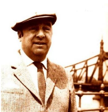
La ciudad de Tacna rindió homenaje a Pablo Neruda, a 106 años de su natalicio.

- Los más importantes medios escritos mexicanos, como La Jornada, El Informador, Milenio y Excelsior, entre otros, realizaron artículos y entrevistas a raíz de la visita a ese país del escritor chileno Hernán Rivera Letelier, reciente ganador del Premio Alfaguara Novela 2010, por su obra El arte de la resurrección .