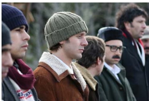
Dawson, Isla 10 de Miguel Littin será presentada en una gala en el 14º Festival de Cine de Lima.